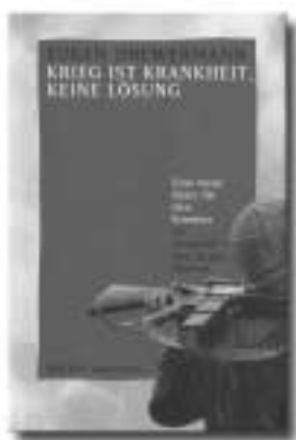
Eugen Drewermann Krieg ist Krankheit, Keine Lösung Herder Verlag, 2002 19,90 Euro

Malwida ruft die Farben. Denn sie ist die Königin der Farben. So sanft berührt oder auch wild voll Energie herum gewirbelt, voll Witz und Lebendigkeit mit überraschenden Wendungen, so geschah mir noch nie. MALWIDA ist einmalig. Die Königin ist wilde, lebensfrohe Aktion und Farben, Farben, Farben. Die Lust auf Buntstiftgekritzel und Farbgekleckse ohne Anspruch, rein aus Freude, kommt unweigerlich beim Anschauen.