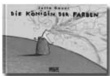
Jutta Becker Die Königin der Farben Beltz Verlag, 2002 11,- Euro

Malwida ruft die Farben. Denn sie ist die Königin der Farben. So sanft berührt oder auch wild voll Energie herum gewirbelt, voll Witz und Lebendigkeit mit überraschenden Wendungen, so geschah mir noch nie. MALWIDA ist einmalig. Die Königin ist wilde, lebensfrohe Aktion und Farben, Farben, Farben. Die Lust auf Buntstiftgekritzel und Farbgekleckse ohne Anspruch, rein aus Freude, kommt unweigerlich beim Anschauen.