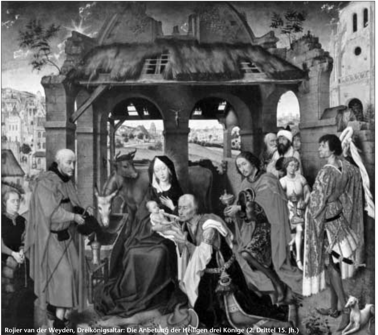
Rogier van der Weyden, Dreikönigsaltar: Die Anbetung der Heiligen drei Könige (2. Drittel 15. Jh.)