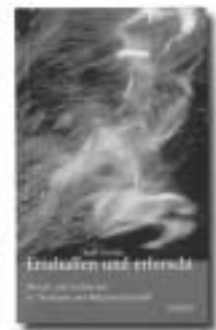
Wolf Krötke Erschaffen und erforscht Mensch und Universum in Theologie und Naturwissenschaft Wichern-Verlag, 2002 7,- Euro

Verträgt sich der Glaube an einen Gott, der die Welt geschaffen hat, mit unserem Wissen vom Werden des Universums, der Erde und des menschlichen Lebens? Wolf Krötke zeigt einen Weg, auf dem die Perspektive des Glaubens und die der naturwissenschaftlichen Forschung miteinander bestehen und sich befruchten können.