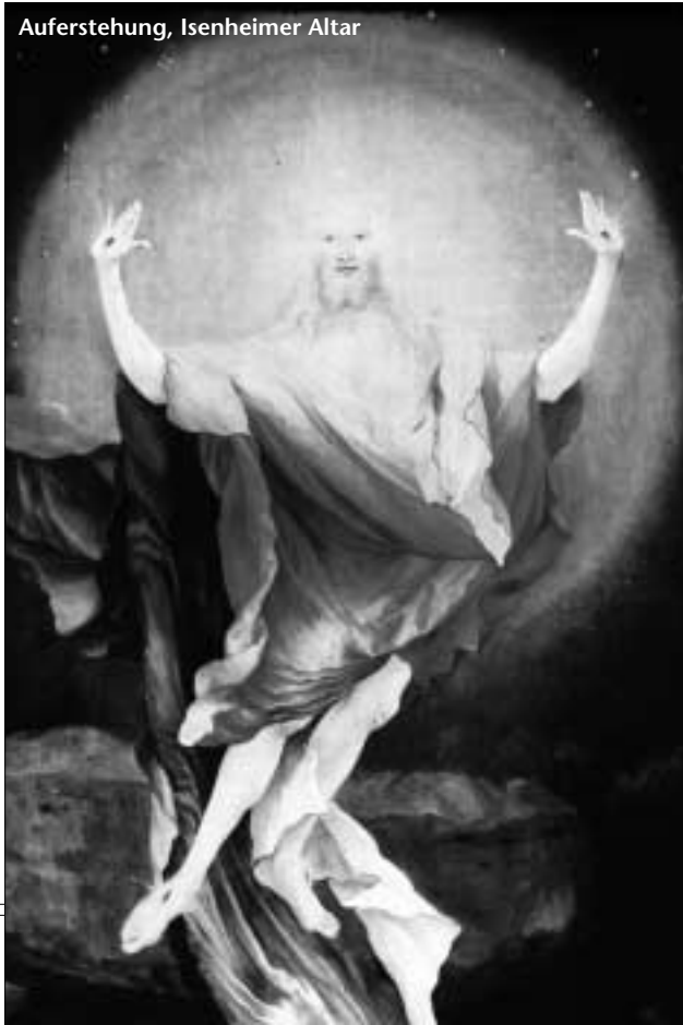
Auferstehung, Isenhaimer Altar