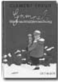
Clement Freud Grimpels Weihnachtsüberraschung Verlag F. Oetinger, 1994 6,40 Euro

Überall weihnachtet es, nur bei den Grimpels nicht. Grimpels Eltern benehmen sich, als sei es Mitte Februar oder Ende August. Das geht Grimpel zu weit. Deshalb beschließt er, Weihnachten selbst zu organisieren.