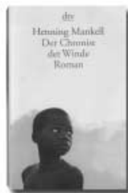
Henning Mankell Der Chronist der Winde dtv, 2002 9,- Euro

Plötzlich war das Wort wieder in aller Munde: Krieg. Radikale Muslime erklären den Heiligen Krieg. Die „gerechte“ Antwort: Kriegserklärung gegen das „Böse“. Ein Kreislauf aus dem es kein Entrinnen gibt? Eugen Drewermann bleibt dabei: Gewaltfreiheit ist keine Utopie – sie ist die einzige Rettung. Seine entschiedenen These: Krieg ist kein Heilmittel, keine Therapie. Krieg ist Wahnsinn.