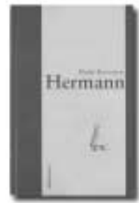
Detlef Berentzen Hermann dielmann-verlag, 2002 20,- Euro

Überall weihnachtet es, nur bei den Grimpels nicht. Grimpels Eltern benehmen sich, als sei es Mitte Februar oder Ende August. Das geht Grimpel zu weit. Deshalb beschließt er, Weihnachten selbst zu organisieren.