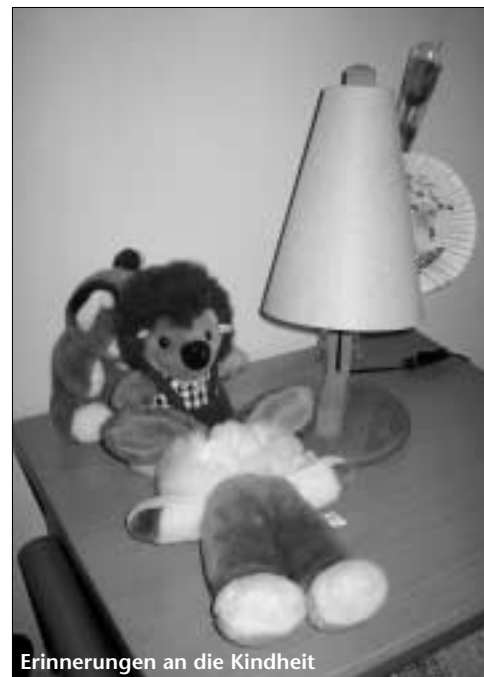
Erinnerungen an die Kindheit