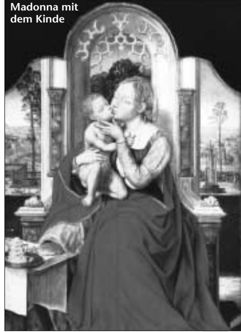
Madonna mit dem Kinde

Etwas von der Fremdheit, die diesem Geschehen innewohnt, scheint der Maler andeuten zu wollen. Er legt viel Raum zwischen die einzelnen Gestalten. Es spannt sich ein