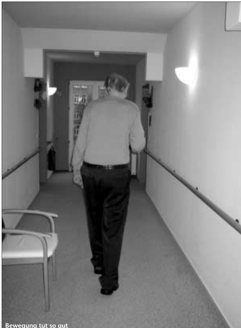
Bewegung tut so gut

Am Heiligen Abend feiert jede Etage für sich. Einen so großen Saal, in dem Heimbewohner und Mitarbeiter Platz finden könnten, gibt es nicht im Heim. Auf jeder Etage setzen sich dann die Bewohner zusammen, das Pflegepersonal und die Familienangehörigen und feiern gemeinsam Weihnachten.