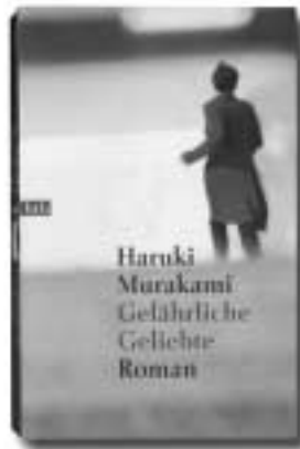
Haruki Murakami Gefährliche Geliebte btb-Verlag, 2002 8,- Euro