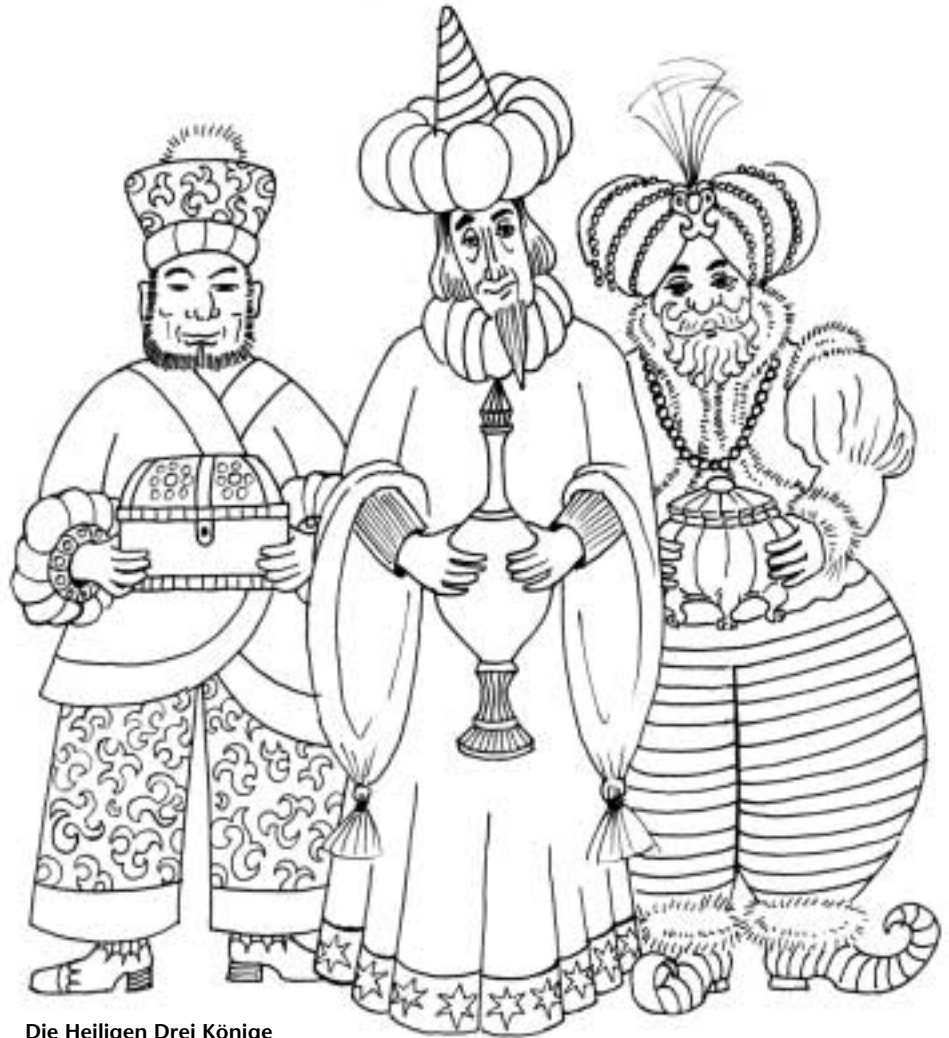
Die Heiligen Drei Könige zum Ausmalen

„Das ist alles noch zu haben!“ ruft die Puppe Annabell.