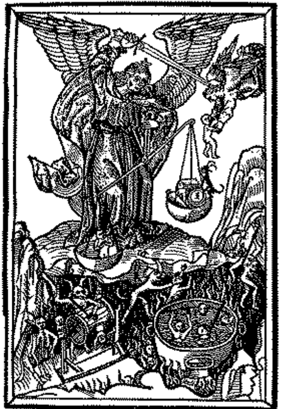
Der Erzengel Michael als Seelenwäger, Druck von 1493

Mit den Worten des Kolosserbriefes läßt sich vielleicht das Zusammenleben einer halbwegs intakten Wohngemeinschaft regeln; vor dem Hintergrund von harter Gewalt und kaum weniger brutaler Gegengewalt scheinen diese Überlegungen naiv.