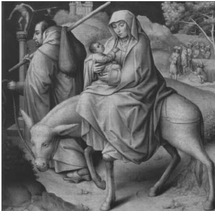
Die Heilige Familie auf der Flucht - Meister von Frankfurt (1460-1533)