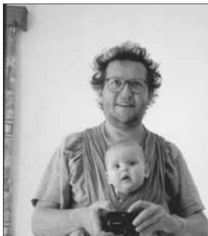
Vater und Tochter im Spiegelbild

Es war schön für mich, daß ich von meiner Frau und den Ärzten in den Fortgang der Schwangerschaft einbezogen war, und so nahm auch mein