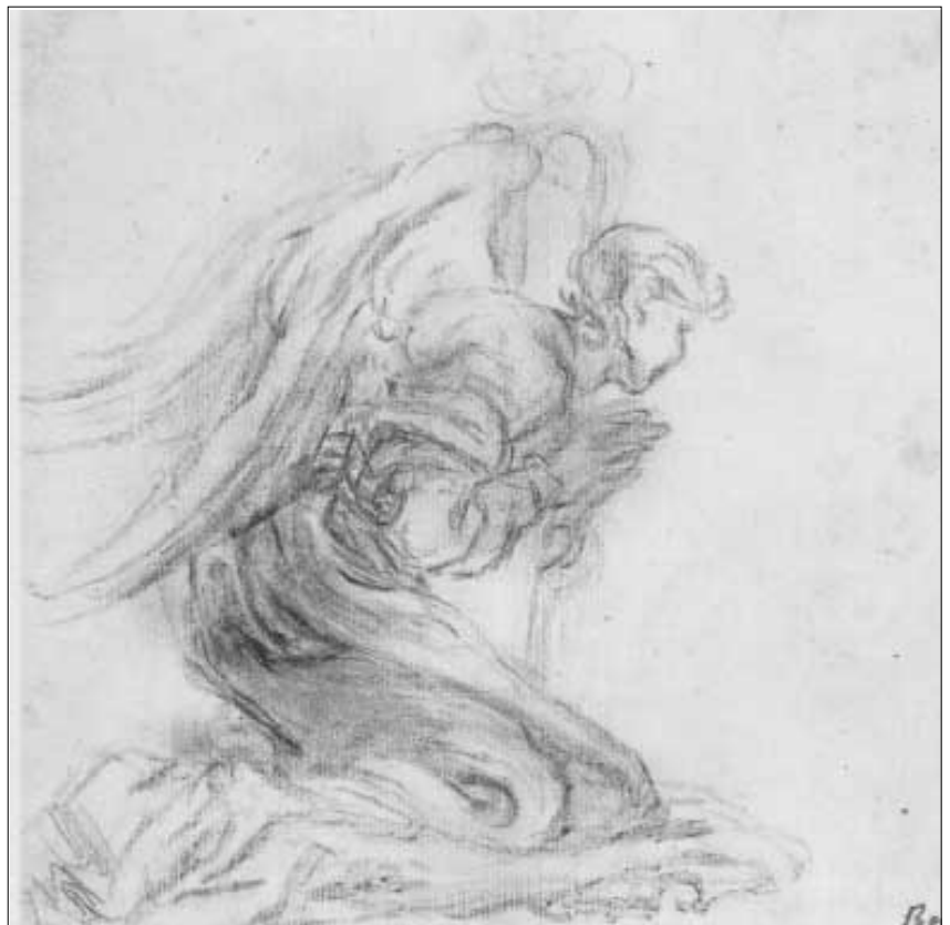
Der kniende Engel, Giovanni Lorenzo Bernini (1598-1680)